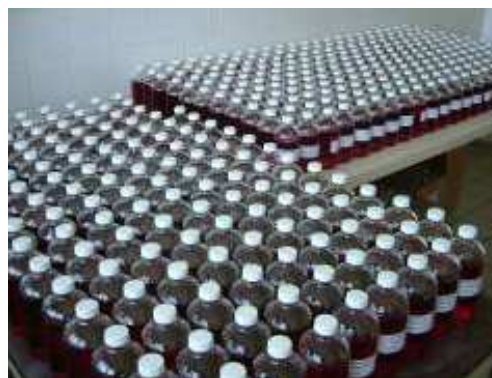
Flacons étalons pour le NIST SRM 2806