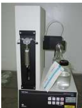
Compteur à absorption de lumière