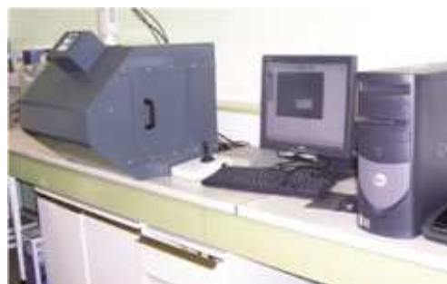
Centre de comptage par microscopie et analyse d'image